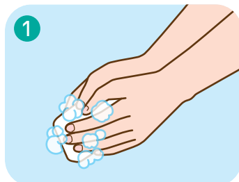
1 石けんをつけ、泡立てる