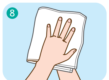
8 石けんを洗い流し、 キレイなハンカチ等でふく